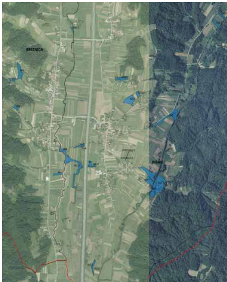
Slika 3. Poljoprivredno zemljište određeno za povrat, Izvor: DGU