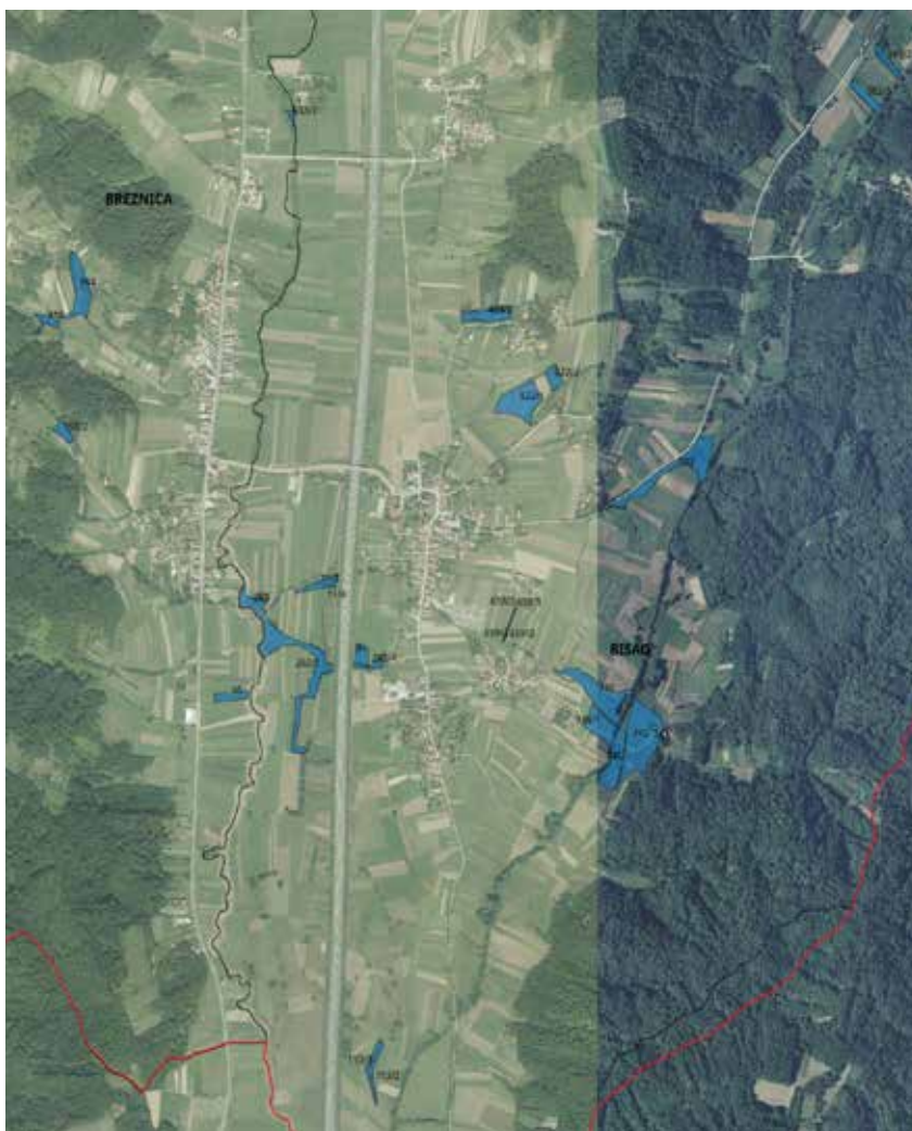
Slika 2. Poljoprivredno zemljište obuhvaćeno Programom

Na području Općine Breznica ne postoje čestice koje se nalaze u obuhvatu postojećeg ili planiranog sustava javnog navodnjavanja.