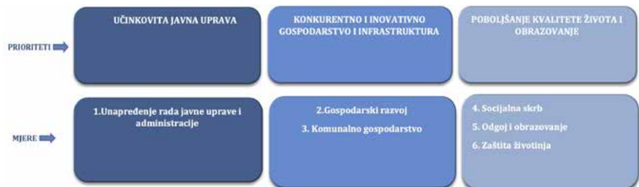
Slika 2. Pregled temeljnih strateških prioriteta i mjera