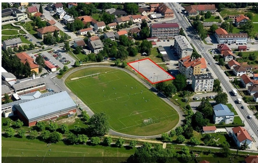
Slika 1. Nogometno igralište »Športski park Novi Marof« s igralištem za razne sportove

U ostvarenju temeljnih dugoročnih ciljeva Grad Novi Marof vodit će se preporukama koje su navedene u Izvješću o obavljenoj reviziji: