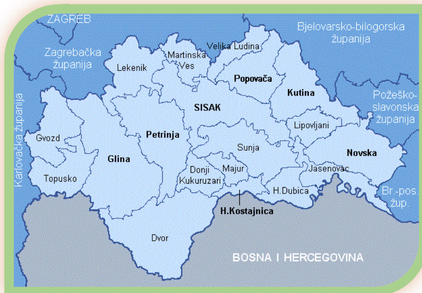
Slika 1. Teritoriji Općine Donji Kukuruzari sa graničnim područjima