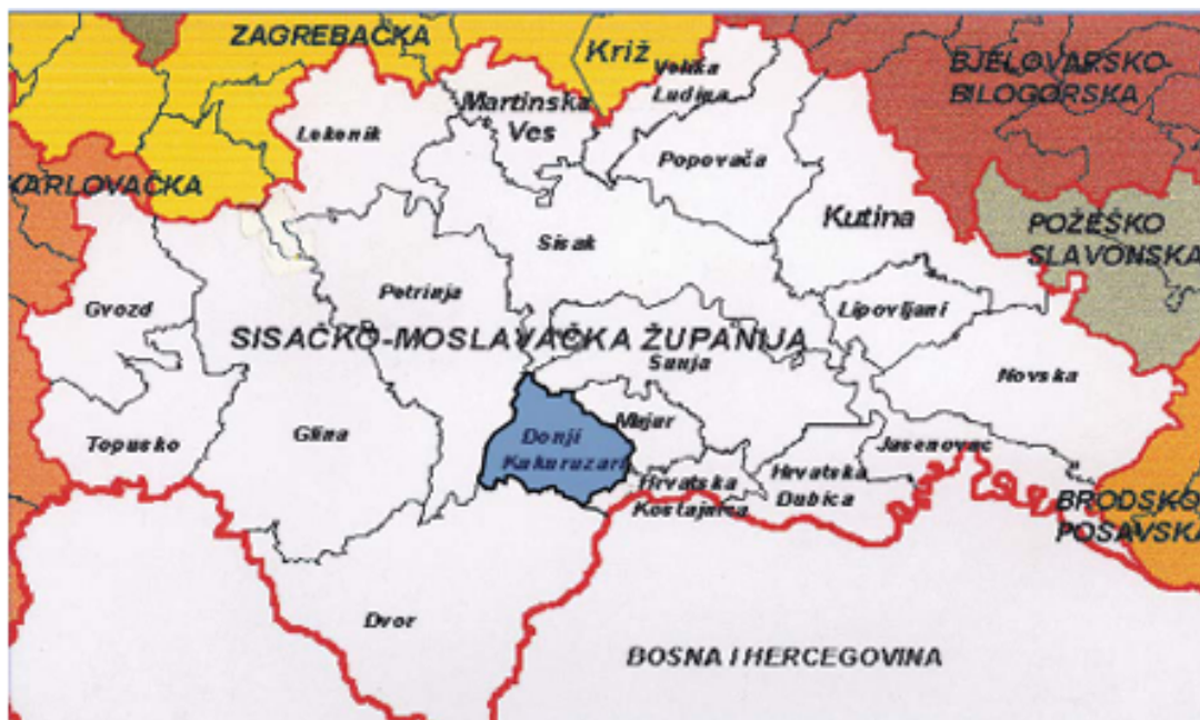
Slika 1. Karta Sisačko-moslavačke županije