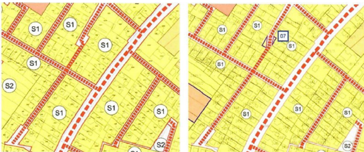
Grafički prikaz 2. Prikaz kč.br. 1788/2 u Urbanističkom planu uređenja Grada Novske - isječak iz Odluke o VI. izmjenama i dopunama Urbanističkog plana uređenja Grada Novske (»Službeni vjesnik«, broj 8/21).