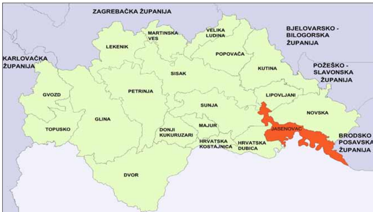
Sl.1. Položaj Općine Jasenovac u Sisačko-moslavačkoj županiji

Općina Jasenovac zauzima površinu od 161,09 km 2 , a što iznosi 3,61 % površine Sisačko-moslavačke županije. Na području Općine Jasenovac nalazi se 10 naselja i to: